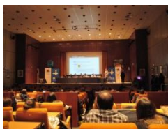
Una foto de la Jornada

Amb motiu d'aquest dia, i coincidint amb la Nit de la Ciència, el 12 d'abril i a la Sala d'actes del Parc Taulí Hospital Universitari va tenir lloc una Jornada amb el lema "Show your rare show you care".