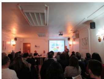
Una imatge de l'Assemblea

L'Assemblea General de Socis es va celebrar el 17 de març a la seu social de l'Associació. En ella es va informar entre altres temes de les línies d'actuació del 2018 i l'estat dels comptes.