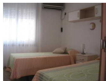
Dues imatges de les instal·lacions del pis d'acollida Reina Elisenda de Montcada – Clos de Sant Francesc