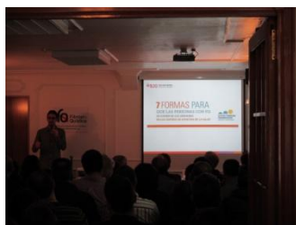
Una imatge de la Jornada